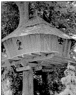
● Perchée dans les arbres, la chambre séduit une cible urbaine.